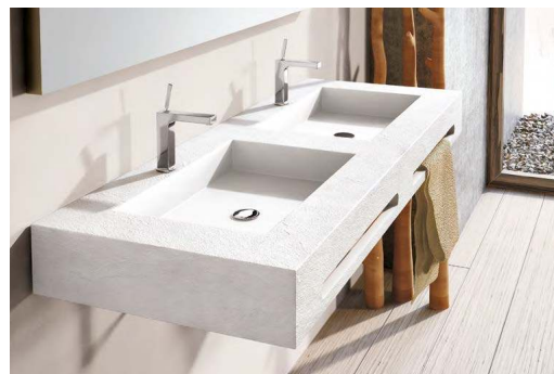
~Lavabo con doble seno y doble toallero. Pizarra BLANCO. ~Washbasin double basin and double towel rail. Pizarra BLANCO.

Pizarra texture provided elegance and warmth. Our slate offers a perfect balance between the traditional and contemporary in bathroom design.