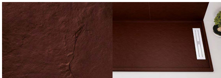
~Detalle textura. Plato semi-marco y panel. Pizarra CEREZO. ~Texture detail. Semi-framed shower tray and panel. Pizarra CEREZO.