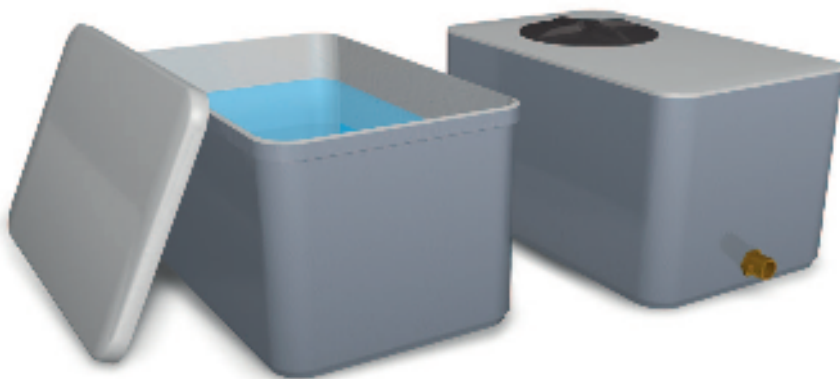
Depósitos rectangular para almacenamiento de agua potable. Instalación en superficie.