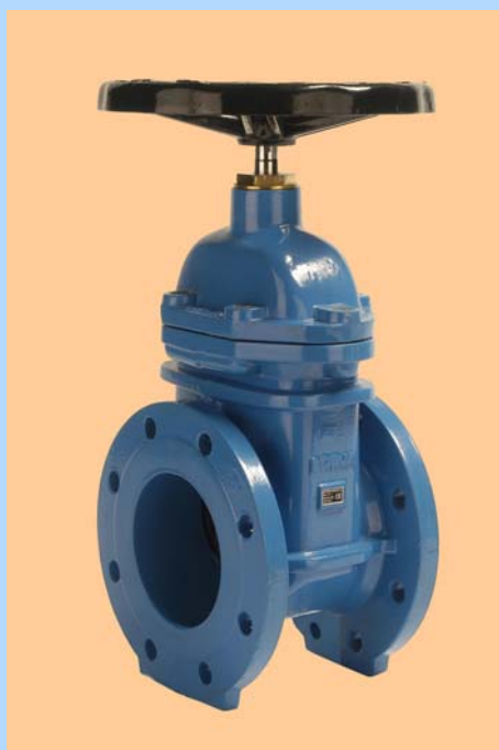
DN 40 hasta 200 FIG.50