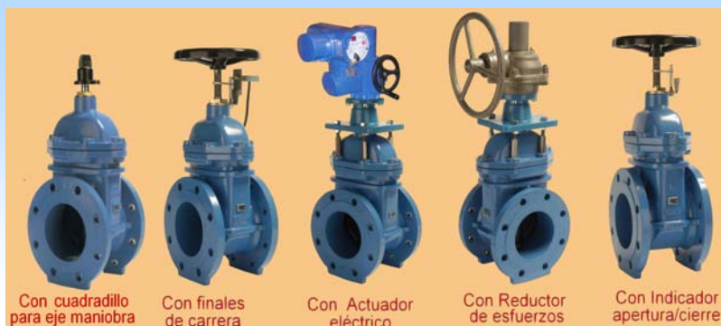
Con cuadradillo para eje maniobra