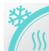
Aislamiento térmico de alta eficacia