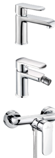
Grifería MISURI a juego. Pag. 91

Nota: Se recomienda tener una presión mínima de 1 bar y máxima de 6 bares para el correcto funcionamiento de esta grifería monomando. Para una correcta instalación es imprescindible efectuar una limpieza de los depósitos calcáreos y restos de suciedad, polvo, restos de arena... antes de su colocación.