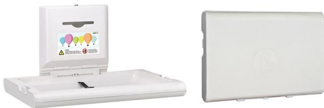
CP0016H Polipropileno acabado blanco