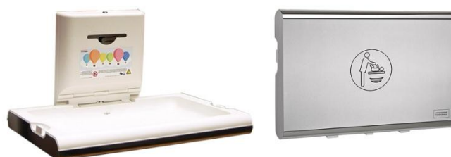
CP0016HCS Polipropileno/Acero inoxidable acabado satinado