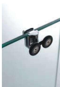
rodamiento rfzdo. doble