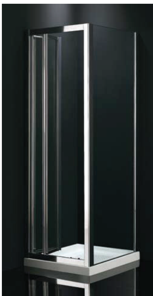
sistema de hojas plegables