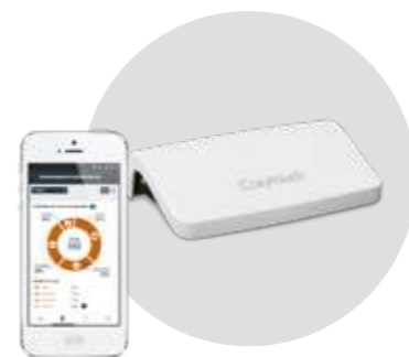
CONTROL A DISTANCIA CON COZYTOUCH Más información en la pág. 14

Datos calefacción según EN 14825. Datos ACS según EN 16147. Datos certificados HP Keymark.